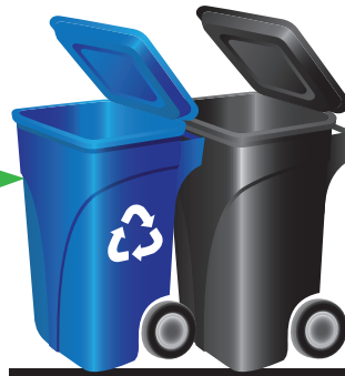
RECICLAJE Y BASURA

Los residentes podrán colocar dos (2) artículos O dos (2) bolsas para recolección junto a su contenedor de basura durante su día programado de recolección de basura y reciclaje en la acera. Artículos voluminosos NO COLOCADOS JUNTO A SU CONTENEDOR DE BASURA NO SERÁN RECOLECTADOS.