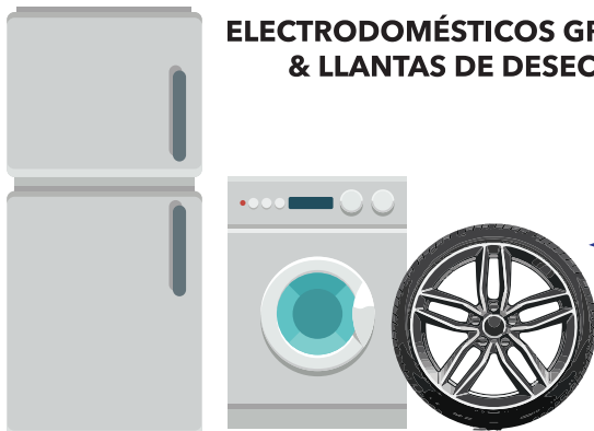
ELECTRODOMÉSTICOS GRANDES & LLANTAS DE DESECHO

Los residentes aún necesitarán programar una cita para todos los electrodomésticos grandes y llantas de desecho mediante la página de internet y a través de PGC311. Los residentes que solo pagan por los servicios de recolección de basura voluminosa o están suscritos a un servicio de recolección privado continuarán programando recolecciones de basura voluminosa a través de PGC311.