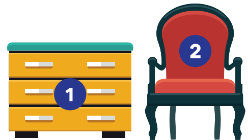
2 ARTÍCULOS VOLUMINOSOS