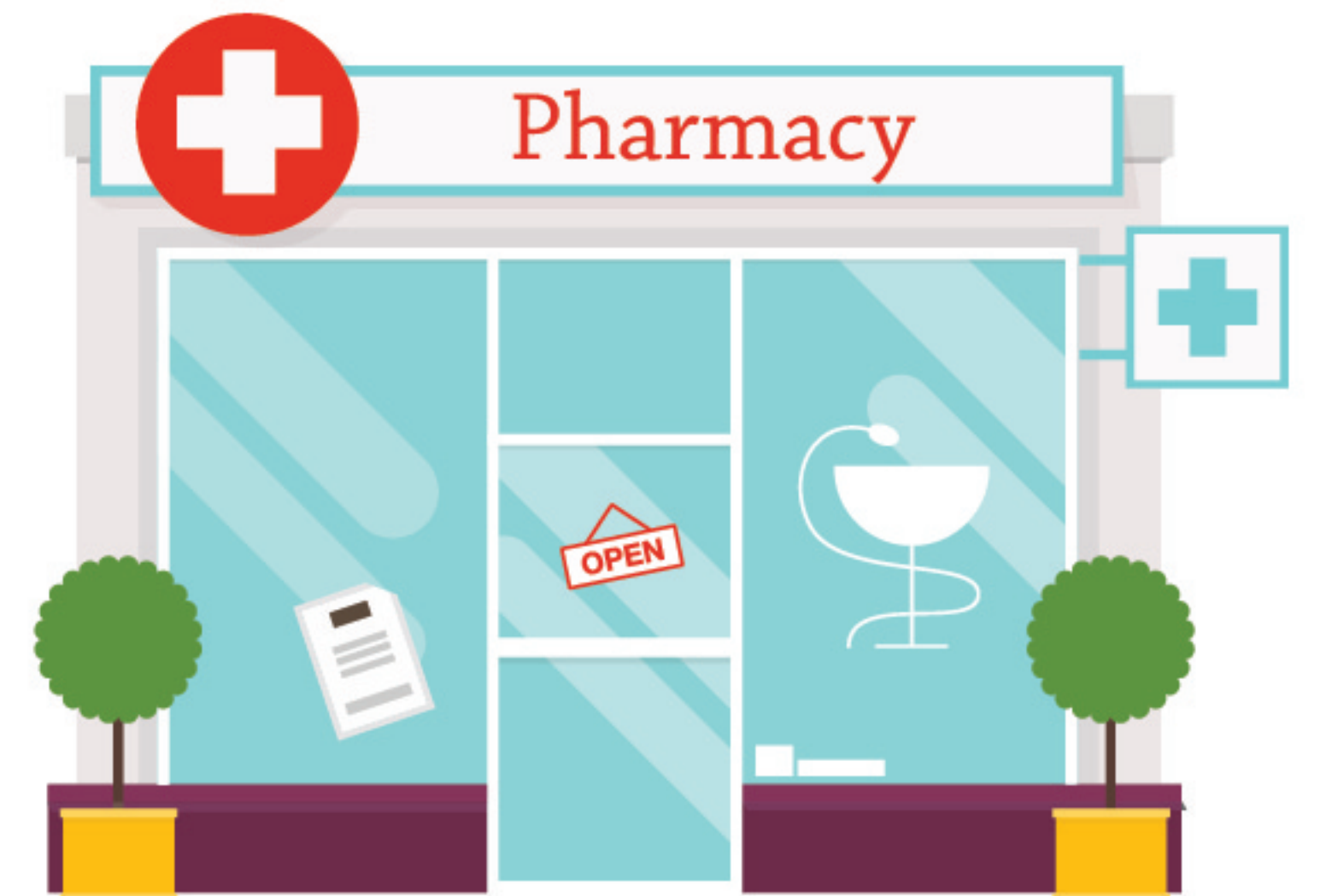
Facilidades de Cuidados Médicos/ Farmacias