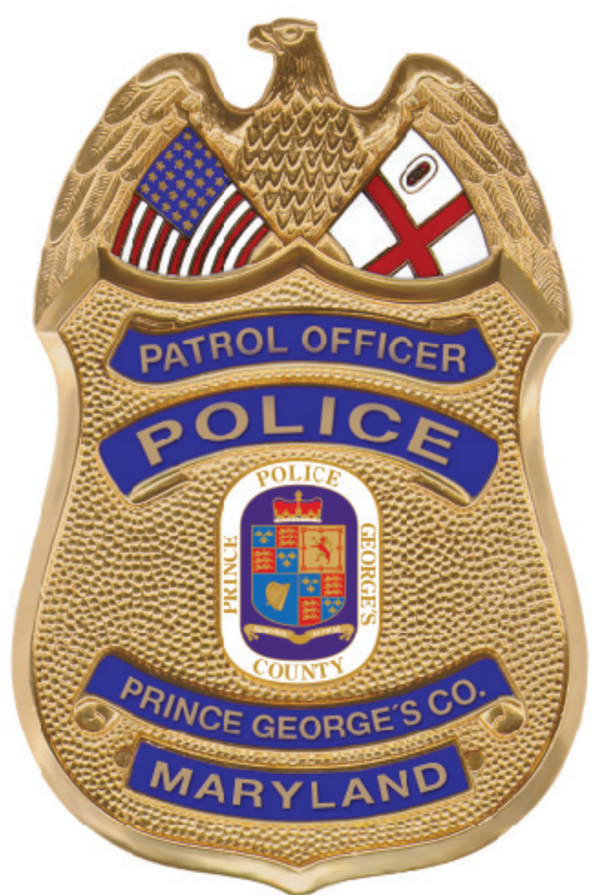
Agencias de la Ley/ Bomberos y Rescate