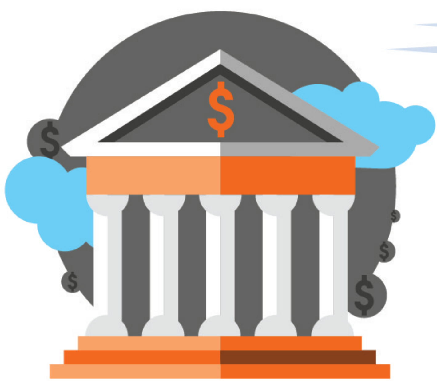
Bancos/Compañías de Seguros

Solo las funciones esenciales permanecerán abiertas: