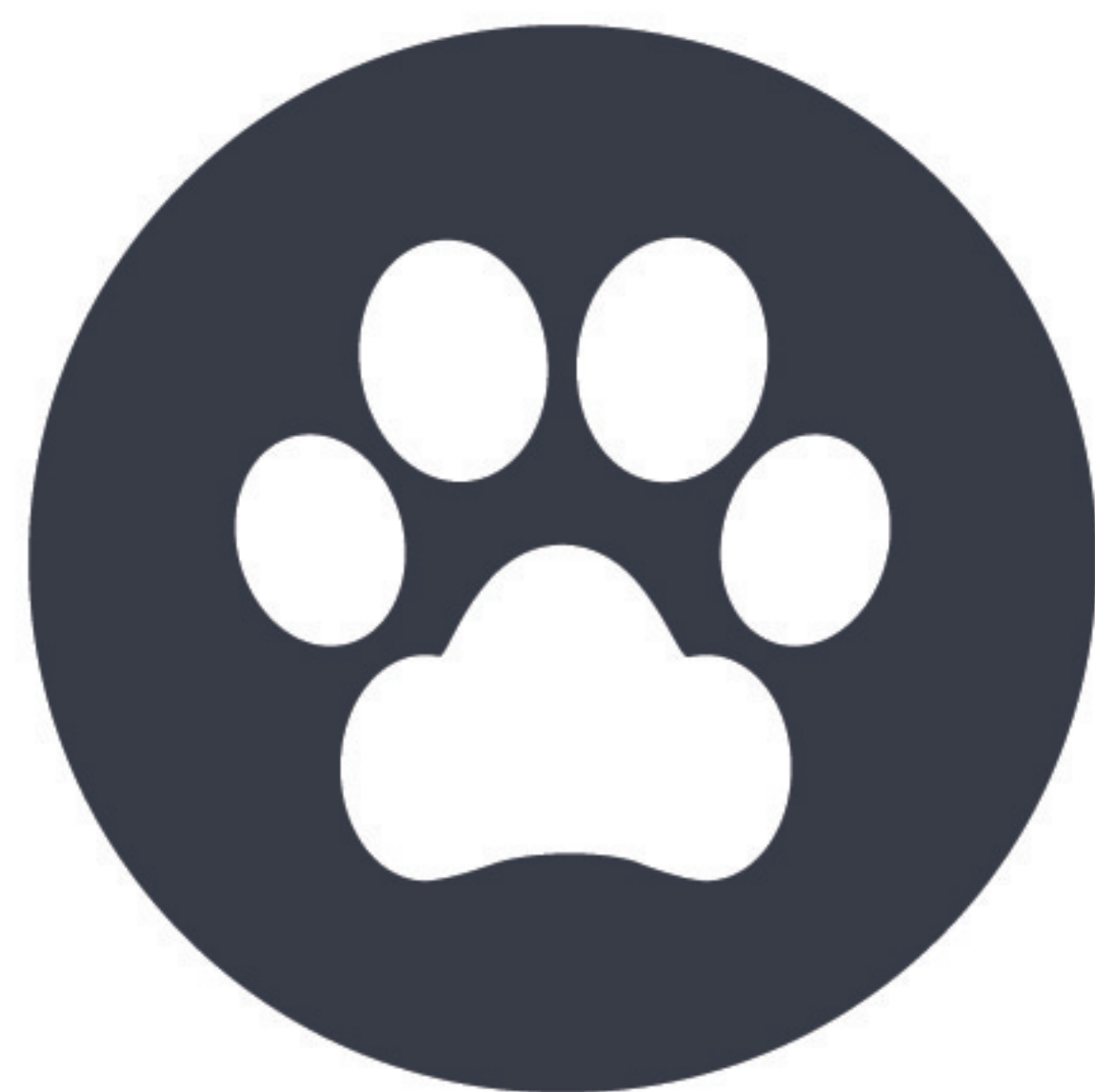
Veterinarios/Tiendas de Suministros para Mascotas