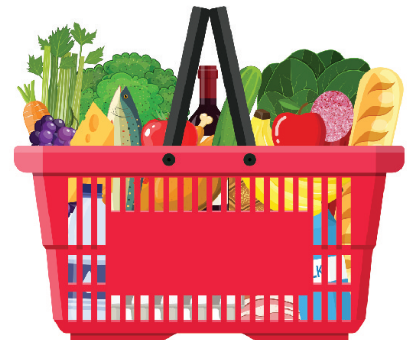
Tiendas de Comestibles