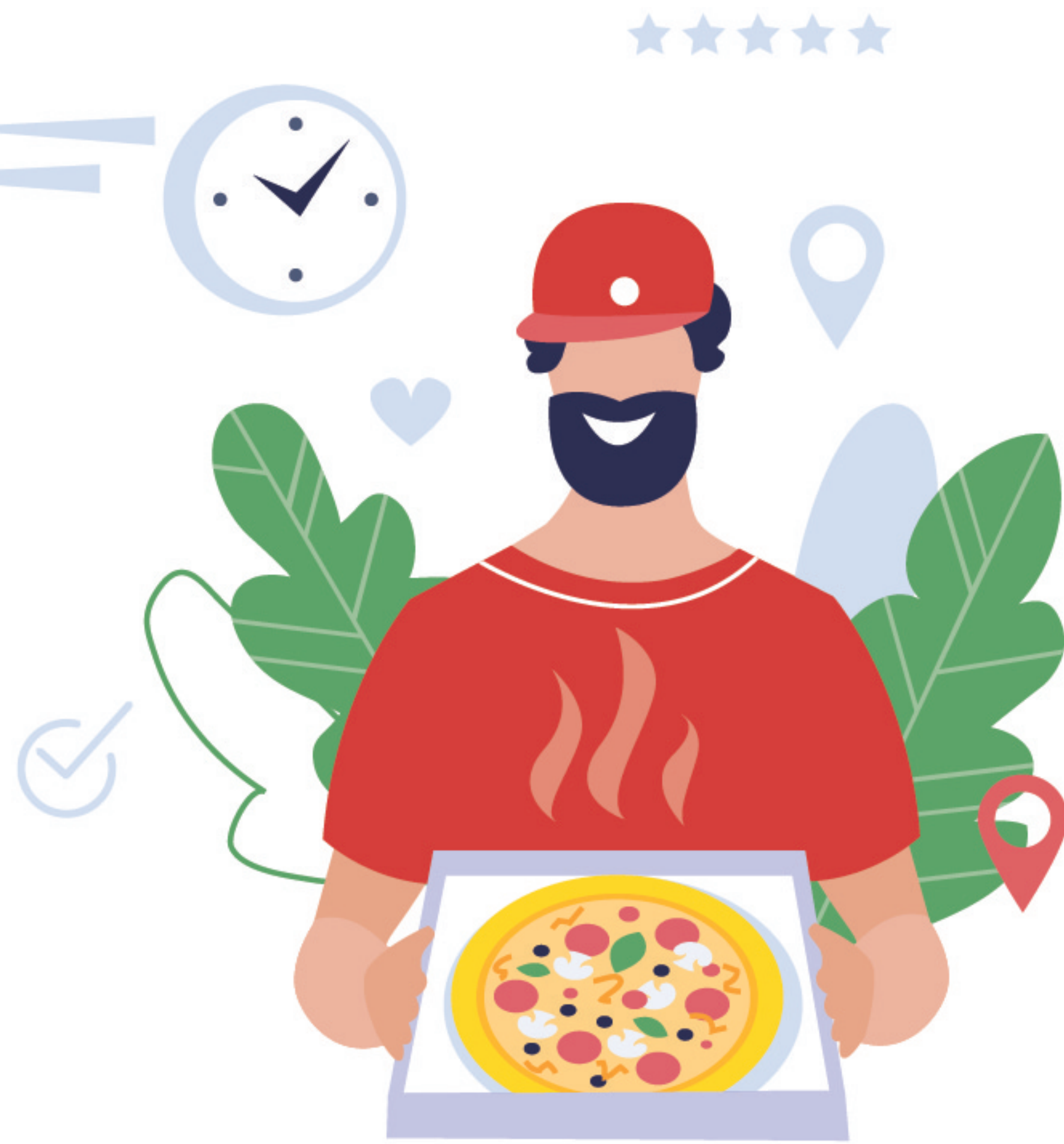
Comida al Domicilio/ Para Llevar